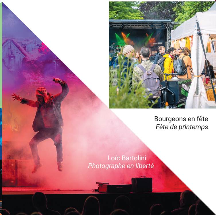
Loïc Bartolini Photographe en liberté