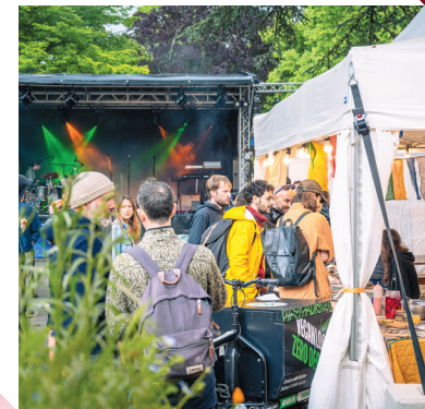
Bourgeons en fête Fête de printemps