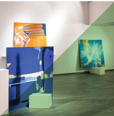
Abigail Janjic Exposition de peintures