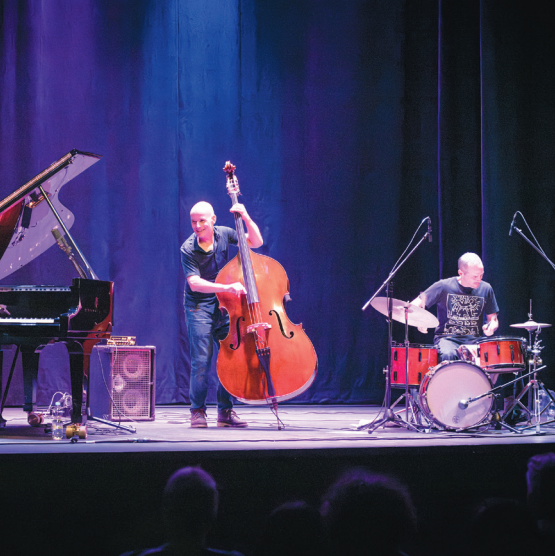
PrismE & Thérèse Trio Jazz Concert