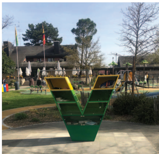
Parc du Grand-Donzel