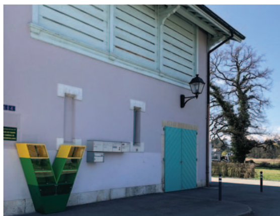
École de Pinchat