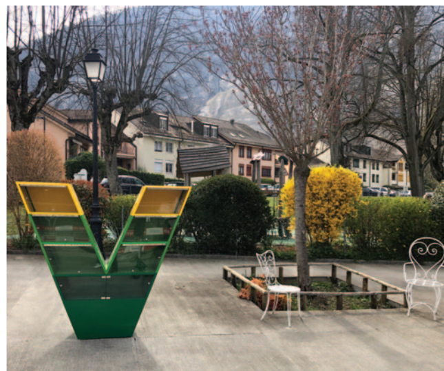
Parc de la Mouille